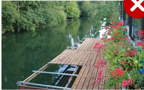
Ponton dans le lit mineur du cours d'eau