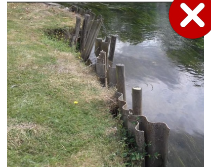
Berges en tôle