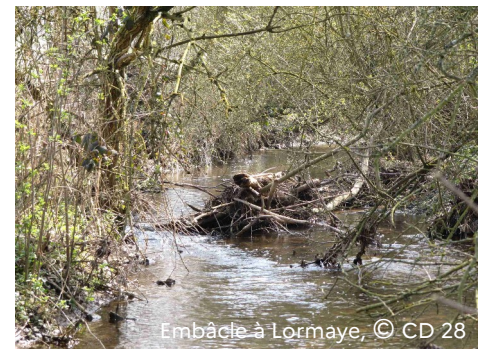
Embâcle à Lormaye