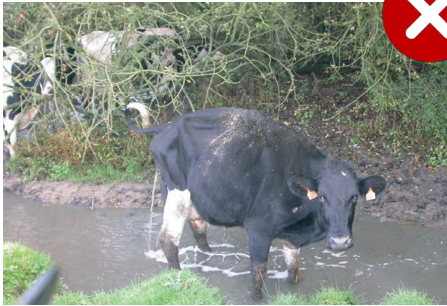
Piétinement des rives et des berges par le bétail