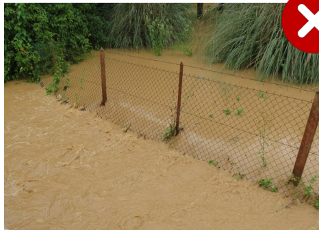
Clôtures non transparentes hydrauliquement