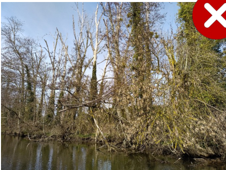
Plantation de peupliers